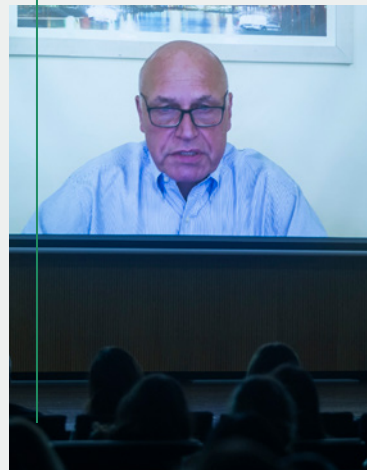
MICHAŁ RUTKOWSKI, DIRECTOR REGIONAL DE DESARROLLO HUMANO EN EUROPA Y ASIA CENTRAL, BANCO MUNDIAL

Necesitamos sistemas de pensiones sostenibles, que generen incentivos a contribuir y proporcionen pensiones adecuadas. El problema con este triángulo del bienestar es que es fácil alcanzar dos de esos objetivos, pero muy difícil conseguir los tres. Cuesta mucho decir cuál es la solución: ¿que todo el mundo reciba las mismas pensiones? ¿Que cada uno reciba justo lo que contribuyó al sistema? A finales del siglo pasado se produjo un gran cambio y se mejoraron los incentivos para contribuir. Pero esta reforma sufrió reveses. Se subestimó el coste de los fondos privados de pensiones. Los beneficios fueron más bajos de lo esperado, lo que causó desilusión. No se cambió lo suficiente. En muchos países existe una elevada presión para jubilarse pronto. Andamos en busca de un nuevo paradigma.